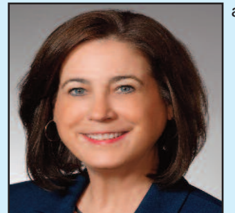
Sue Frost Sacramento County Supervisor

On May 14th, the Sacramento Transportation Authority voted to approve an expenditure plan for a local half-cent sales tax increase across Sacramento County by a vote of 11-5 that will very likely go on the ballot in November. I voted "no" for four main reasons, and want to take this opportunity to explain what they are.