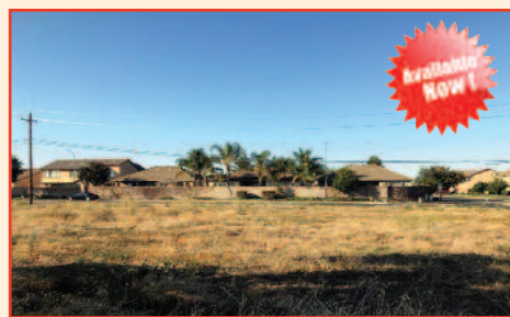
3 Bedroom 1 Bath Home on 10 Acre Lot Listing Price: $1,500,000