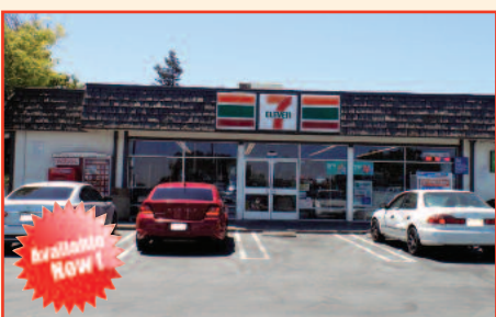
7Eleven 7 Eleven Store For Sale in Antioch, CA Listing Price: $550,000