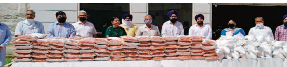
ਦੇਣ ਲਈ ਤਰੁਨ ਵਾਲੀਆ ਦਾ ਵਿਸ਼ੇਸ਼ ਧੰਨਵਾਦ ਕਰਦੇ ਕਿਹਾ ਕਿ ਅੱਜ ਦੇ ਹਾਲਾਤ ਵਿਚ ਅਜਿਹੀ ਸੇਵਾ ਬਹੁਤ ਮਾਅਨੇ ਰੱਖਦੀ

ਕੌਰ ਕੰਬੋਜ ਦੇ ਵਾਰਡਾਂ ਵਿਚ ਜ਼ਰੂਰਤਮੰਦ ਪਰਿਵਾਰਾਂ ਨੂੰ ਵੰਡੀਆਂ ਜਾਣਗੀਆਂ। ਵਾਹਦ ਅਤੇ ਬਾਘਾ ਨੇ ਰਾਸ਼ਨ ਕਿੱਟਾਂ